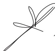
LOREM IPSUM Gerent Grup Gestió Girona lipsum@gestioirona.cat

Aquesta obligació es contempla en el RD 1065/2007 de 27 de juliol; el que passa és que encara no s'ha posat en marxa degut a la gran complexitat que això suposa, però tots els indicis indiquen que al 2009 serà obligatori per a les empreses esmentades anteriorment. Resulta evident que l'IVA és un dels impostos sobre el que la Inspecció d'hisenda té fixada la seva atenció.